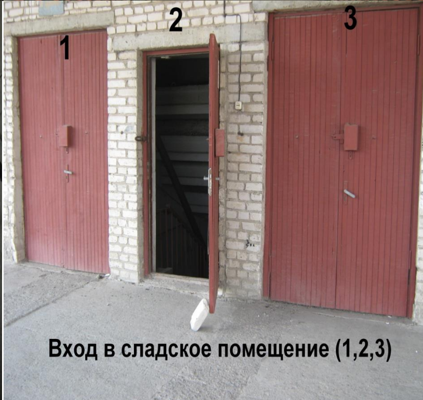
Вход в сладкое помещение (1,2,3)